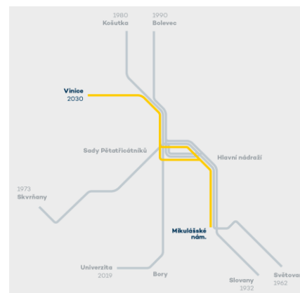
Schéma linkového vedení: