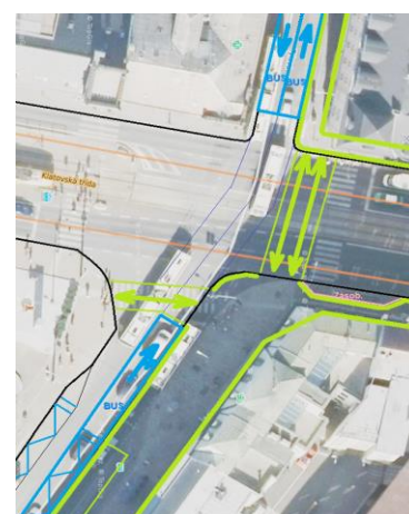
úsek u křiž. U Práce, opatření 24E v návaznosti na opatření 16 (možný cílový stav)