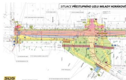
Situace přestupního uzlu Milady Horákové